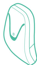
コントロールユニット